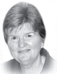
Nicole Bilodeau, pht