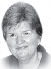
Nicole Bilodeau, pht