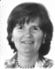
Nicole Bilodeau, pht